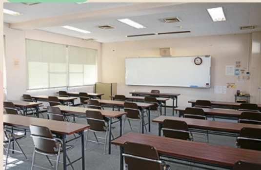
第2研修室 (本館2階) 長机横3列×縦4列