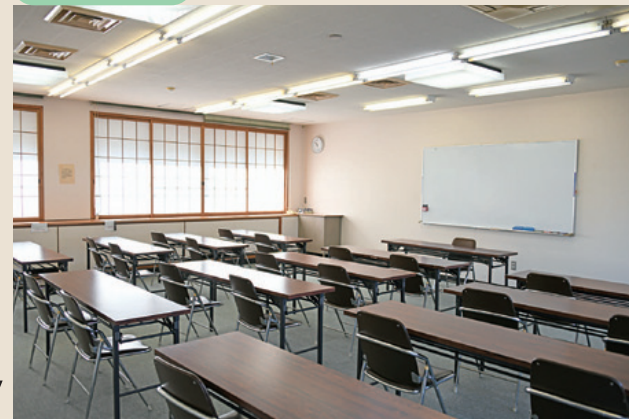
第3研修室 (本館2階) 長机横3列×縦4列