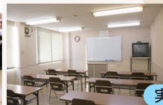
実習研修室 (実習棟) 長机横2列×縦3列