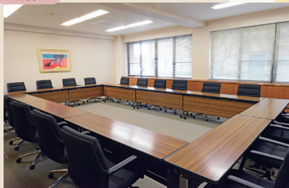
会議室 (本館1階) 長机10机